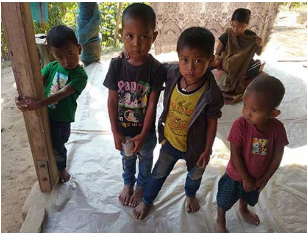
Kinder in Khumulwng

die Menschen an ihrem Ort einsetzen. Wir freuen uns, dass wir sie bei ihrer Arbeit begleiten dürfen und finanziell unterstützen können.