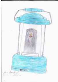
Losa Ahya 2.Klasse