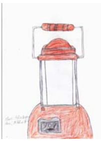
Esther Bagang 3. Klasse