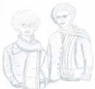
Sunday Doka 3. Klasse

Die Fördersumme setzt sich zusammen aus den Kapitalerträgen der Niclas Stiftung und Spenden. Spenden kamen von Privat Spendern direkt auf das Bankkonto der Niclas Stiftung, über betterplace.de oder payback.de . Außerdem unterstützte die Stadt Düsseldorf wie in den vergangenen Jahren das Schulprojekt in Seppa mit Mitteln aus der Aktion "Düsseldorfer helfen Kindern in der Dritten Welt". Außerdem stellten die Schuhmacherei Summek, die Salzgrotte Kristall und Blumen Ast (alle Düsseldorf) Spendendosen auf.